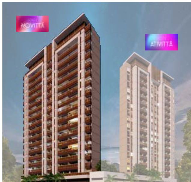
Tabela de disponibilidade abril 2026