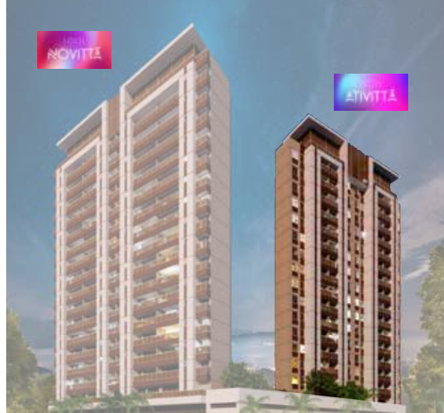
Tabela de disponibilidade abril 2026 55,20m 2 | Torre ATIVITTÁ