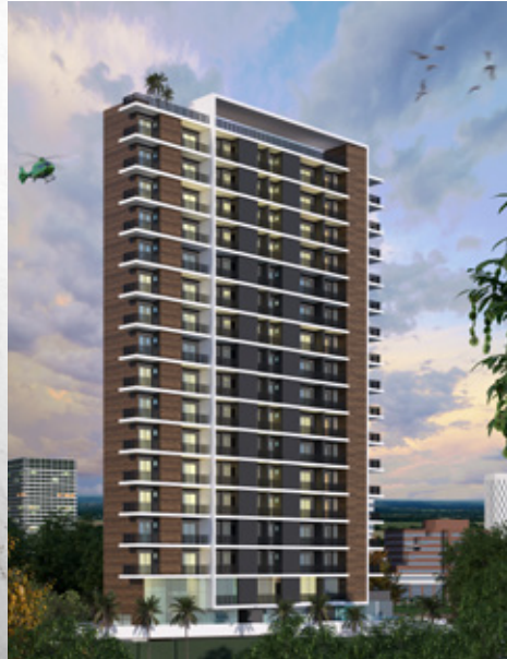
Tabela de disponibilidade abril 2026