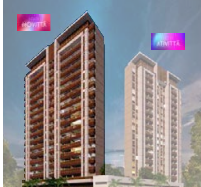
Tabela de disponibilidade novembro 2024 77,52m 2 | Torre NOVITTÁ